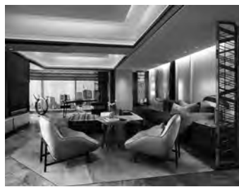
ザ ロイヤルパーク キャンパス (左上) ニッコースタイル (右上) メズム東京 (左下)