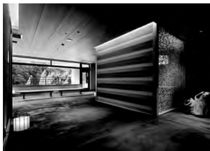
三井デザインテック